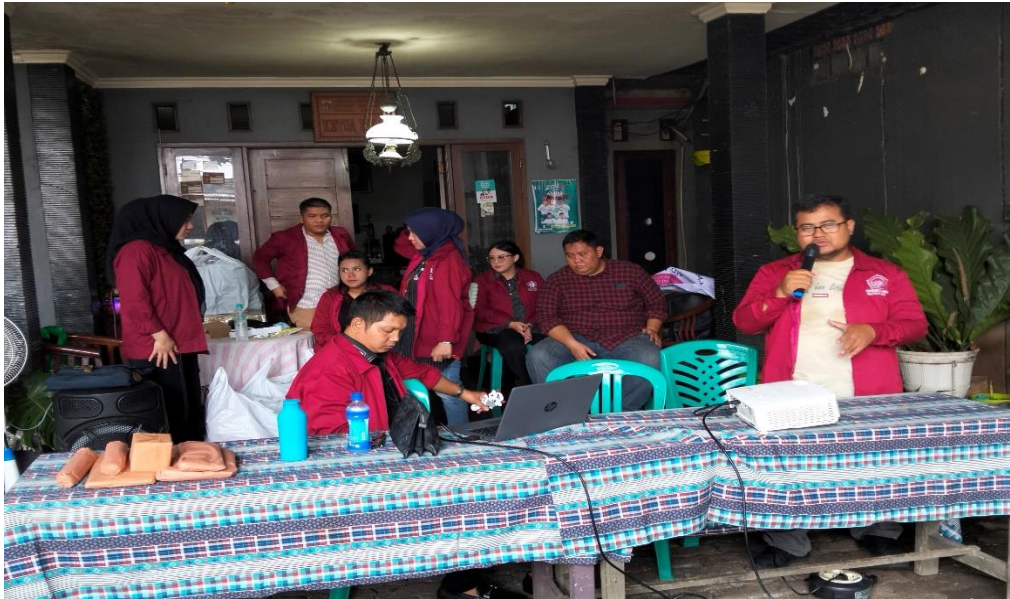
Gambar 3. Penyampaian materi penyuluhan di RW 14 Kelurahan Bintaro