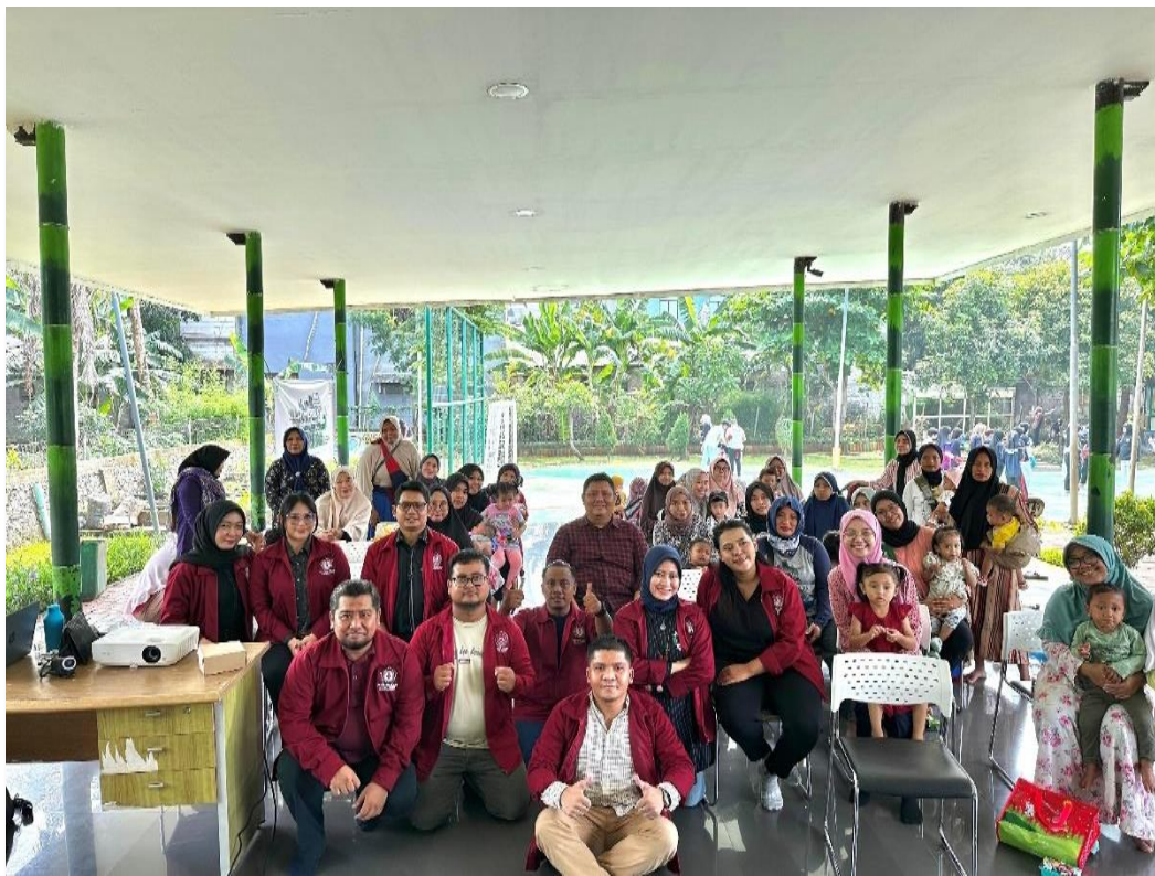
Gambar 2. Penyuluhan di RPTRA RW 6 Kelurahan Bintaro

Dengan memanfaatkan data kesehatan yang terjadi di masyarakat Kelurahan Bintaro dapat menguatkan peserta dengan pemahaman yang lebih baik tentang kompleksitas isu pertumbuhan ekonomi keluarga, gizi anak, dan praktik malnutrisi. Hal ini akan membantu dalam merumuskan strategi dan kebijakan yang lebih efektif dalam mengatasi masalah tersebut di Kelurahan Bintaro Kecamatan Pesanggrahan Jakarta Selatan. Dan berikut adalah gambaran selama kegiatan yang dilakukan antara lain sebagai berikut :