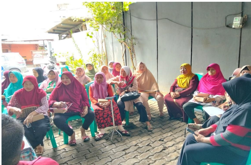
Gambar 4. Peserta penyuluhan di RW 14 Kelurahan Bintaro

Hasil dari kegiatan tersebut peserta sudah memahami konsep manajemen keluarga dan dampaknya pada angka stunting. Harapan besarnya adalah Feedback peserta bisa menggambarkan bagaimana peserta menilai penyuluhan yang diberikan, apakah mereka merasa materi bermanfaat, dan apakah mereka merasa lebih siap untuk mengambil tindakan setelah penyuluhan. Tindakan konkret yang diidentifikasi peserta yang akan mereka ambil setelah penyuluhan ini bisa termasuk rencana untuk memperbaiki pola makan keluarga,