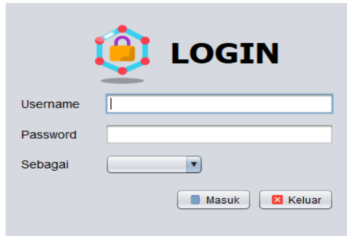
Gambar 1. Form Login