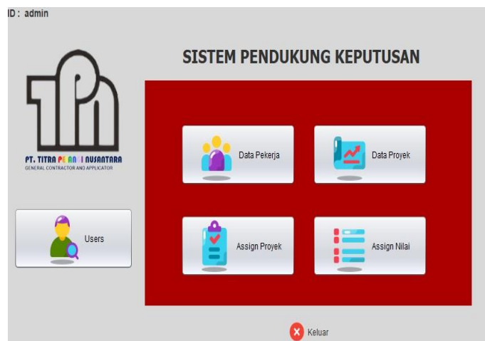
Gambar 2. Form Menu Utama