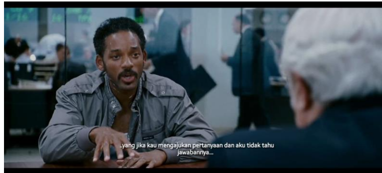
Gambar 2 – Pada saat Chris wawancara di perusahaan pialang (45:00)

Terefleksi saat Chris berusaha mencari pekerjaan tetap dan tempat tinggal yang layak. Dalam salah satu adegan, ia berkata kepada manajer HRD: “I’m the type of person, if you ask me a question and i don’t know the answer, I’m gonna tell you that i don’t know. But I bet you I know how to find the answer, and I’ll find the answer.” Ucapan ini memperlihatkan motivasi kuatnya untuk mendapatkan kepastian kerja demi keamanan finansial dan masa depan anaknya.