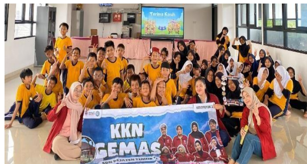
Gambar 3. Sosialisasi Budaya dan Bahasa Dua Negara ASEAN

Pada program Sosialisasi Budaya dan Bahasa Dua Negara ASEAN, kondisi awal menunjukkan keterbatasan wawasan siswa terhadap budaya regional dan bahasa asing. Setelah pelaksanaan kegiatan dengan metode “Petualangan Budaya Serumpun”, siswa, khususnya kelas 6, menunjukkan peningkatan pemahaman terhadap budaya Indonesia dan Malaysia serta perbedaan dan persamaan bahasa secara kontekstual. Kegiatan ini tidak hanya memperluas wawasan global siswa, tetapi juga menanamkan nilai toleransi dan keterbukaan terhadap keberagaman budaya sejak dini.