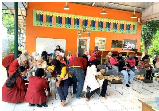
Gambar 4. Pendampingan Pembuatan Dan Aktivasi Akun QRIS

Pada bidang ekonomi, program Digitalisasi UMKM melalui penerapan sistem pembayaran QRIS menghasilkan capaian yang sesuai dengan target pengabdian. Pelaku UMKM yang sebelumnya belum mengenal transaksi non-tunai telah berhasil memiliki akun QRIS yang aktif dan siap digunakan dalam kegiatan usaha. Pendampingan secara langsung mulai dari sosialisasi hingga aktivasi akun meningkatkan kepercayaan pelaku UMKM terhadap penggunaan teknologi digital. Hal ini menunjukkan bahwa literasi digital yang disertai pendampingan praktis mampu mendorong adaptasi UMKM terhadap sistem pembayaran modern yang lebih efisien dan transparan.