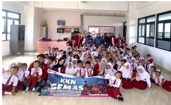
Gambar 2. Sosialisasi Anti Perundungan

Pada program Sosialisasi Budaya dan Bahasa Dua Negara ASEAN, kondisi awal menunjukkan keterbatasan wawasan siswa terhadap budaya regional dan bahasa asing. Setelah pelaksanaan kegiatan dengan metode “Petualangan Budaya Serumpun”, siswa, khususnya kelas 6, menunjukkan peningkatan pemahaman terhadap budaya Indonesia dan Malaysia serta perbedaan dan persamaan bahasa secara kontekstual. Kegiatan ini tidak hanya memperluas wawasan global siswa, tetapi juga menanamkan nilai toleransi dan keterbukaan terhadap keberagaman budaya sejak dini.