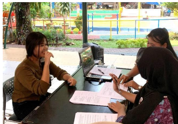
Gambar 5. Diskusi Hasil Tes Minat dan Bakat Remaja

Sementara itu, pelaksanaan Tes Minat dan Bakat Remaja menggunakan metode RIASEC memberikan hasil berupa peningkatan kesadaran remaja terhadap potensi diri yang dimiliki. Melalui tes tertulis dan sesi konsultasi singkat, remaja memperoleh gambaran mengenai kecenderungan minat dan kepribadian yang dapat dijadikan dasar dalam perencanaan pendidikan dan pilihan karier. Hasil ini menunjukkan bahwa pengenalan potensi diri sejak dini memiliki peran penting dalam membantu remaja merencanakan masa depan secara lebih terarah.